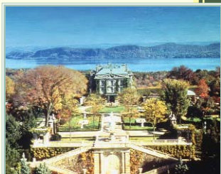
Kykuit, Sleepy Hollow

Comprende Kykuit, las Casas Solariega Rockefeller y Phillipsburg, Sunnyside, Union Church de Pontantico Hills y Van Cortlandt Manor. 631-8200 www.hudsonvalley.org .