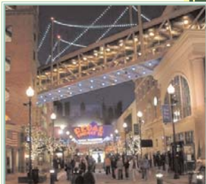
New Roc City, New Rochelle

pista de patinaje, canchas para practicar bateo de béisbol, un teatro de cine IMAX y carreras de caballo. 637-7575 www.newroccity.com